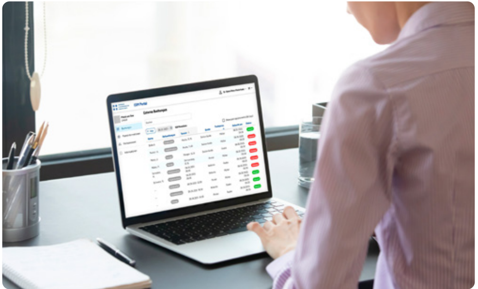
Aktuelle Terminübersicht der Online-Buchungen

www.aerztekasse.ch/ angebotsuebersicht/ software-erweiterungen/ online-terminbuchung/